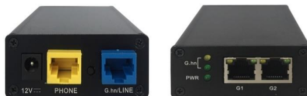
Panel und LED-Beschreibung